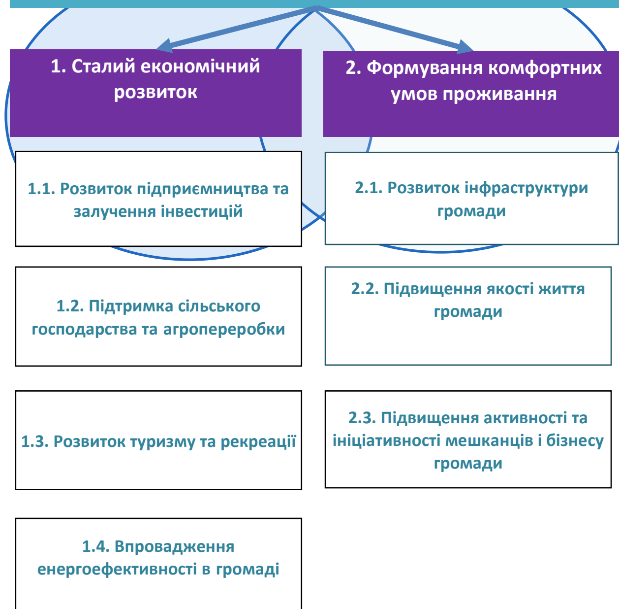
Малюнок 2 Стратегічне бачення, стратегічні та операційні цілі

Михайлівська територіальна громада - культурна, історична, аграрна та рекреаційна громада, розташована на березі річки Тясмин, вздовж автомобільної дороги Н01. Ініціативне та працююче населення і дієва місцева влада забезпечили можливості для самореалізації та розвитку підприємництва, аграрного і переробного бізнесу, туризму та досягнення європейських стандартів життя. Природа наділила громаду корисними копалинами і природно-рекреаційними зонами. Стародавні, могутні ліси та екологічно чисті водойми сформували умови для відпочинку і відтворення населення, збереження культурної та духовної спадщини краю.